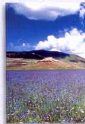
"...in het Nationale Natuurpark Monti Sibillini..."

Wie van sport houdt kan zijn hart ophalen: il Collaccio biedt u mini-voetbal, volleybal, tennis, jeu de boules, zwemmen en bergwandelen. Vanuit het zwembad kunt u genieten van een schitterend uitzicht op het omringende berglandschap. Bij de dichtbijzijnde manege worden prachtige tochten te paard georganiseerd. Verder kunt u zich vermaken met fietsen, paragliding, hanggliding, en kanoën. In Ussita bevindt zich één van de grootste kunstschaaftsbanen van Europa. En wie van het nachtleven houdt kan in een kwartier rijden de disco bereiken.