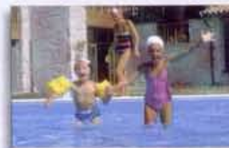
"...aan de behoeften van kinderen wordt extra aandacht geschonken..."