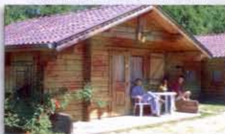
"...de chalets zijn comfortabele houten vakantieverblijven..."