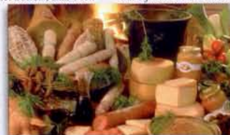
"...de voortreffelijke smaak van de Umbrische produkten..."

Naast lekker eten ook cultuur Kunststeden zoals Perugia, Assisi, Orvieto en Spello zijn in een dik uur per auto te bereiken. Een verrassende rijkdom aan cultuur vindt u echter ook in de streek zelf, de Valnerina, in stadjes zoals Norcia, Cascia, Preci en Spoleto: hier kunt u nog talrijke getuigenissen van een bloeiend verleden bezichtigen zoals Romaanse abdijen en kleine kluisenaarskerkjes. Il Collaccio behartigt het