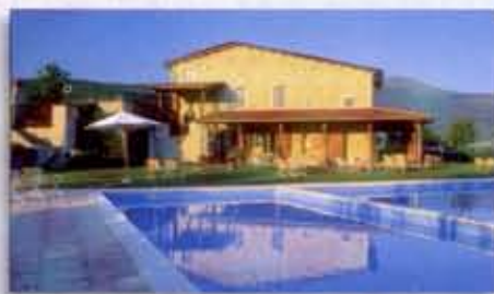
"...het grote massieve landhuis van fraaie natuursteen..."