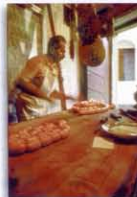
"...de culturele identiteit van het gebied..."

Op enkele meters afstand beneden liggen de nieuwe zwembaden, een kinderbad en een groot zwembad, met schitterend uitzicht op de vallei Valcastoriana en het dorpje Preci.