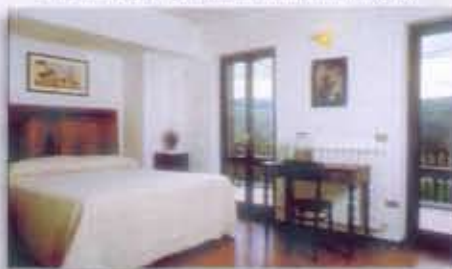
"...de kamers zijn smaakvol ingericht met meubilair uit de jaren '30..."

afstand van Il Casale Grande. Elke slaapkamer, met vier tot tien stapelbedden, is voorzien van een eigen badkamer.