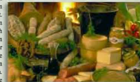
köstliche umbrische Gerichte

Wir lieben Kinder und haben bei der Planung des „Il Collaccio“ vor allem auch an sie gedacht: Daher gibt es zwei Kinderschwimmbekken, wo die Kleinen unter Aufsicht ihrer Eltern Spaß haben können. Neben den Pools gibt es sogar eigene Kindertoiletten. Am „Il Collaccio“ können die Kinder unter freiem Himmel herumlaufen, neue Freundschaften schließen und eine Menge neuer Dinge entdecken. Vor allem können sie sich aber am Leben auf dem Land erfreuen, eine Erfahrung, die sie nicht so schnell vergessen werden und für die sie Ihnen ein Leben lang dankbar sein werden.