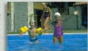
Die Bedürfnisse der Kinder immer vor Augen