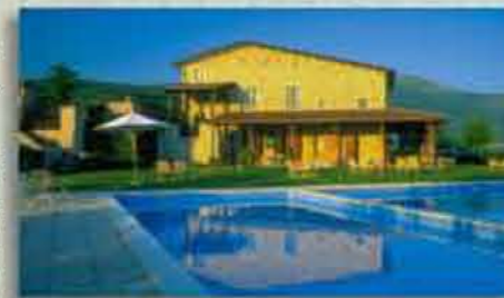
Casale Grande, ein massives Natursteinhaus

Die Holzbungalows, in unmittelbarer Nähe des Schwimmbads, bestehen aus einem Innenraum und einer Veranda. Auf der Veranda sind ein Tisch und Stühle vorhanden; im Zimmer befinden sich vier Betten (1 Doppelbett und 1 Stockbett), sowie eine Kochnische mit Kühlschrank. Die Sanitäranlagen sind in unmittelbarer Nähe.