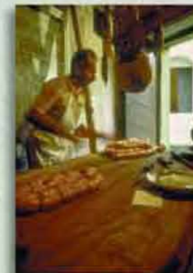
Kulturelle Identität in der Umgebung

Ein Blick auf die Preisliste dürfte Sie davon überzeugen, dass sich ein Aufenthalt in diesem bezaubernden und friedlichen Ambiente auf jeden Fall lohnt!