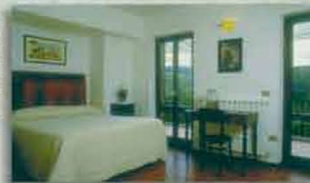
Gästezimmer, mit Originalmöbeln aus den Dreißigern

Die Chalets hingegen sind gemütliche Holzhäuser, ausgestattet mit Wohnzimmer, zwei Schlafzimmern, Küche mit Herd und Kühlschrank, Bad. Natürlich verfügen die Chalets über genügend Platz, um an einem lauen umbrischen Abend draußen zu essen.