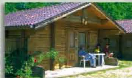
Die Chalets, gemütliche Holzhäuschen