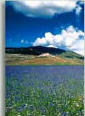
Der „Monti-Sibillini“ Nationalpark

ein kleiner Fußballplatz, ein Volleyballfeld, ein Boccia-Bereich, ein Tennisplatz und zwei Schwimmbäder, welche eine grandiose Aussicht auf die umliegende Landschaft bieten; außerdem besteht die Möglichkeit, Mountainbikes auszuleihen. Auch kann man in der Umgebung wunderbar Drachen- und Gleitschirmfliegen. Die Flüsse Nera und Corno sind geradezu ideal zum Raften und Canoeing. Ferentillo, eines der bekanntesten Klettergebiete Italiens, liegt nur 40 km entfernt. Überdies liegt Ussita, mit einer der größten Eishallen Italiens, ganz in der Nähe. Wenn Sie dann noch mehr Lust auf Bewegung haben, gibt es eine halbe Autostunde entfernt eine großartige Disco.